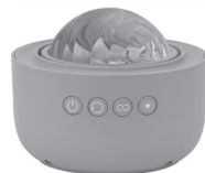
Modo de proyección

El modo de luz nocturna contiene todos los efectos dentro de la esfera. El modo de proyección hace brillar los efectos en el techo y la pared. El funcionamiento de los botones es el mismo.