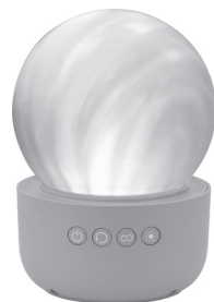
Modo de luz nocturna