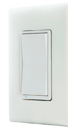
Interruptor inteligente con Bluetooth para exteriores GE (de pared) Modelo #13869

La versión de pared con Bluetooth de GE ofrece el mismo control Bluetooth mediante el control del tomacorriente con un interruptor.