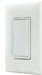
Interruptor inteligente con Bluetooth para exteriores GE (de pared) Modelo #13869

La versión de pared con Bluetooth de GE ofrece el mismo control Bluetooth mediante el control del tomacorriente con un interruptor.