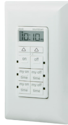
Temporizador myTouchSmart (de pared) Modelo #26893

El temporizador de pared myTouchSmart ofrece controles fáciles de programar mediante el control del tomacorrientes con un interruptor.